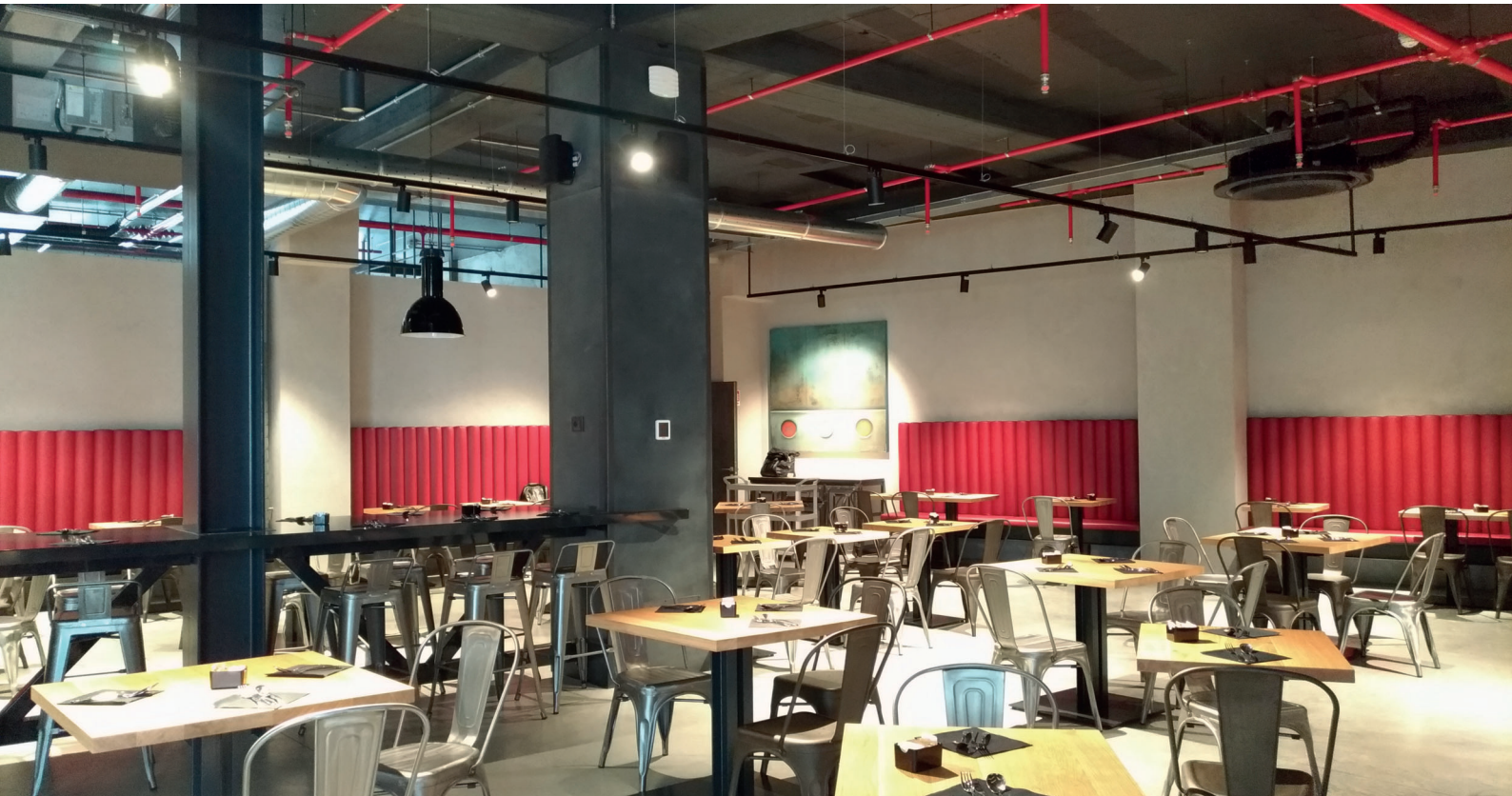
J24 Hotel - Milano, giugno 2019