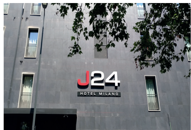
Facciata J24 Hotel

Il J24 Hotel, situato a Milano in posizione strategica per visitare le principali attrattive della metropoli, è una struttura di nuova costruzione caratterizzata da uno stile industriale e minimalista. Adatto ad una clientela internazionale, sia business che leisure, offre ai propri Ospiti camere dotate di ogni comfort. L'hotel dispone di un'ampia sala ristorante e un lounge bar.